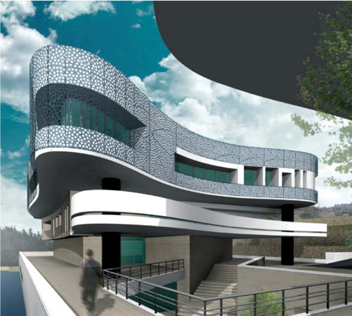
Perspective of the extension project.