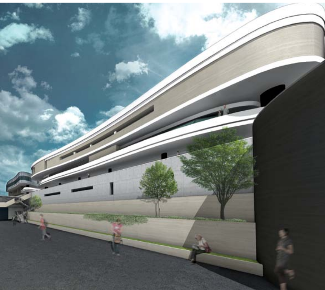
Perspective du projet d'extension.